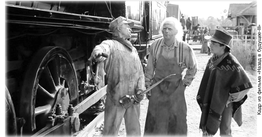
Кадр из фильма «Назад в будущее-III»

К слову: “потянет” это железнодорожный сленг, перешедший оттуда в повседневную речь. Он кратко, в одно слово, определяет тип и мощность локомотива: потянет он этот состав с нужной скоростью или же не потянет.